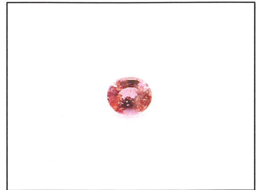
Dieses Bild dient nur der Identifikation und stellt nicht die Originalgröße bzw. die tatsächliche Farbe dar.